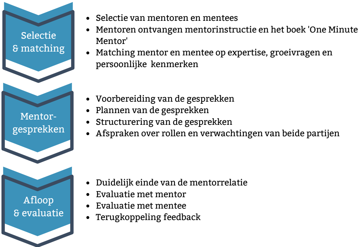
figuur 2: mentorproces nlgroeit

Het mentorproces van nlgroeit omvat drie stappen: selectie & matching, mentorrelatie en afloop & evaluatie.